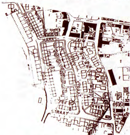
DE ZUID-WESTELIJKE UITBREIDING

De huidige vorm dankt het dorp aan het feit dat ieder jaar in september Neerlandsch oudste paardenmarkt wordt gehouden. De bijbehorende gemakkelikheden aarden het meest in het centrum van het dorp. Zo heeft Valkenburg dan sinds 1980 een Castellum plein.