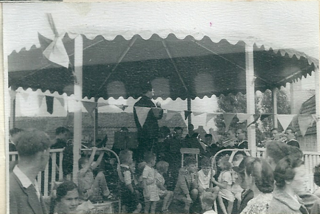
Fanfareklanken bij de opening

Valkenburgs Harmonie verzorgde het avondconcert op een wijze, zoals we het kunnen verwachten. In grote groepen maakte de jeugd rondom de tent haar rondedansen en alles bij elkaar genomen was het ons een groot genoegen aan het einde van deze feestdag te mogen vaststellen, dat geen wanklank de goede stemming had verstoord.