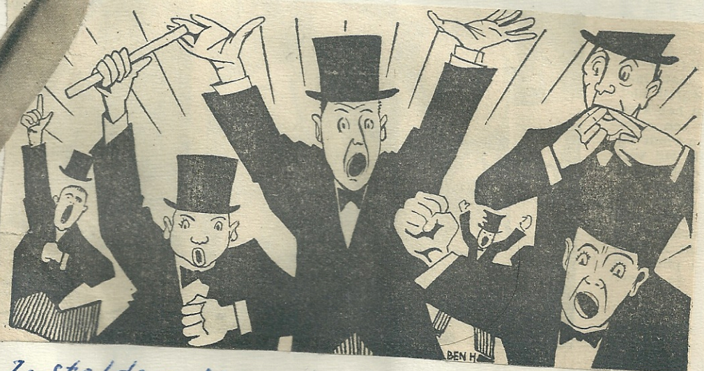
Zo stelden sommige mensen zich het Marktcomité voor.

En van je hela, hola, houdt er de moed maar in.